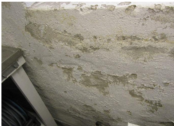
Fuktgenomslag och färgsläpp längs yttervägg