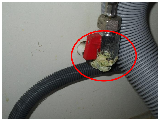
Korrosion på rörkoppling under diskbänk