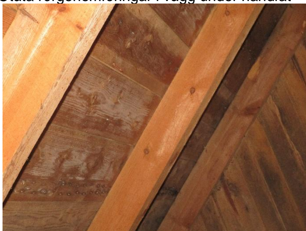
Tendenser till mikrobielltillväxt längs yttertaketets insida