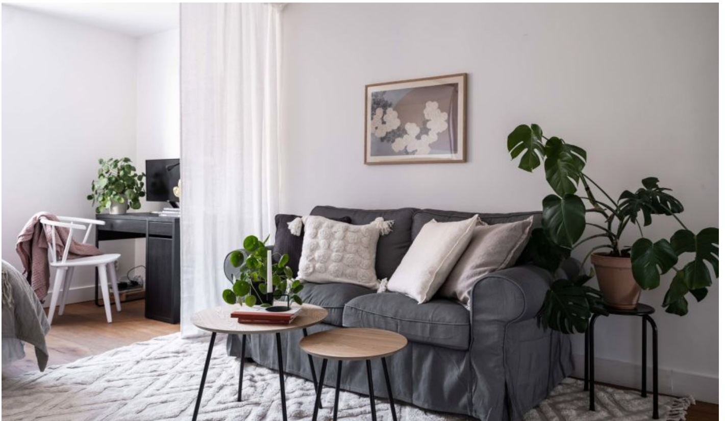
Välplanerat vardagsrum och kök med plats för soffa, matplats och sovalkov.