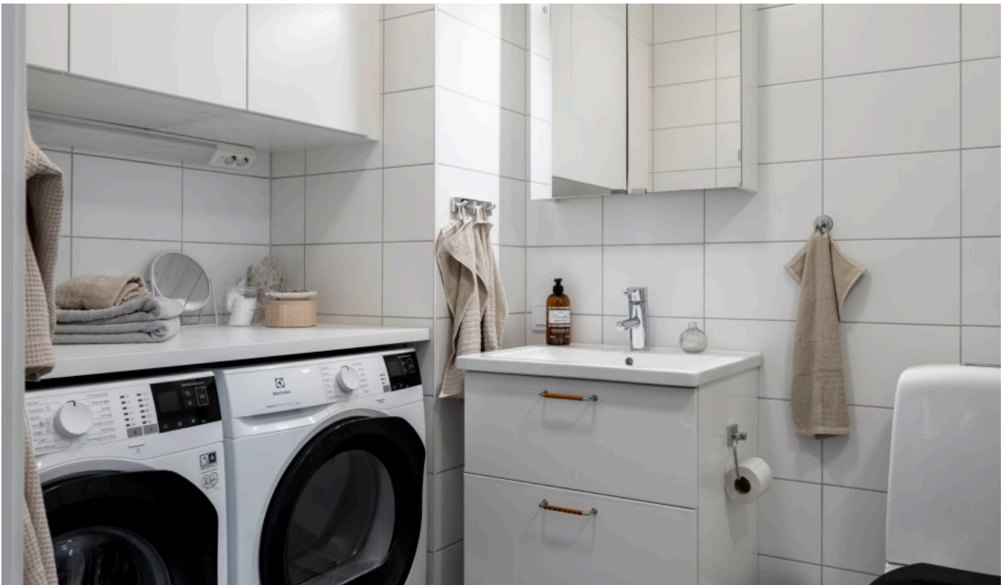
Helkaklat badrum med tvättmaskin och torktumlare