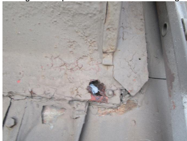
Plåt intill skorsten är rostig