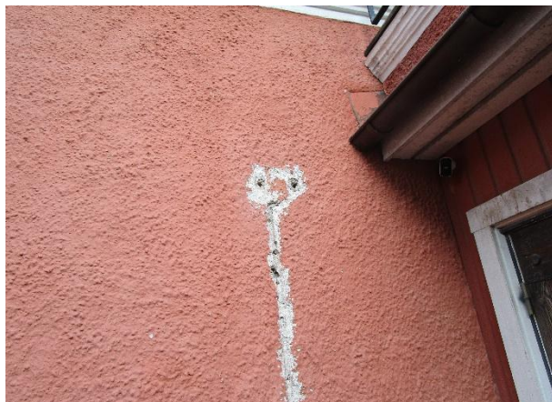
Det finns brister i fasadens puts