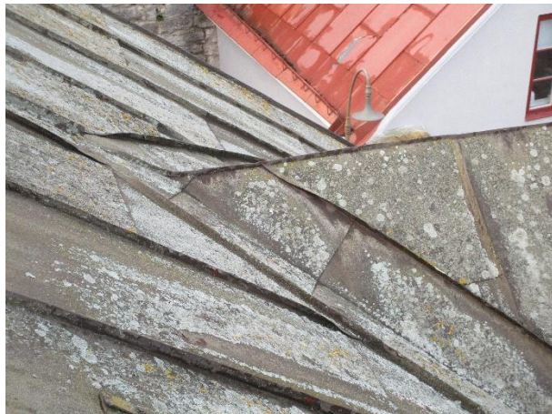
Taket är mossbeväxt