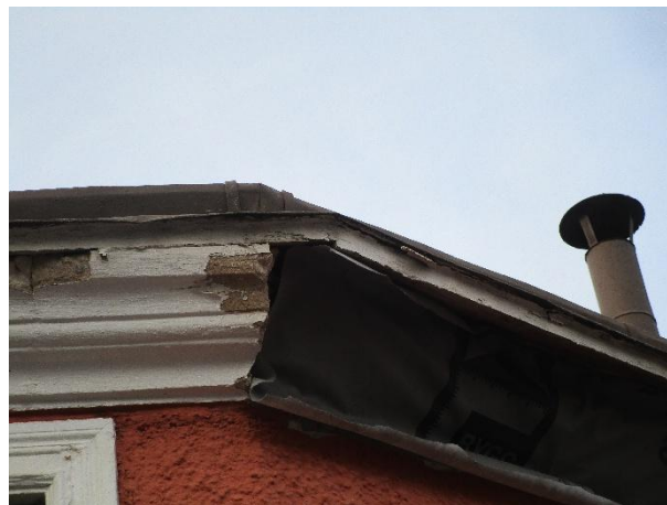
Gesims har släppt