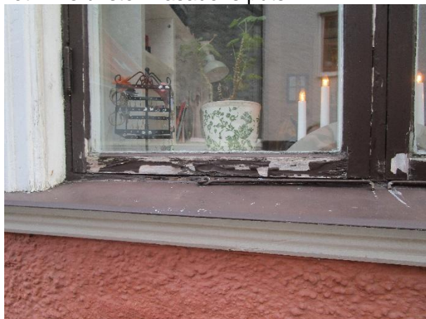
Fönstren har ett eftersatt underhåll