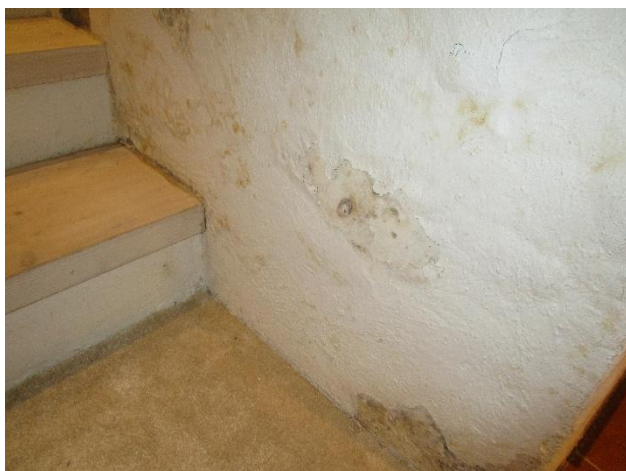
Fuktgenlag längs väggar