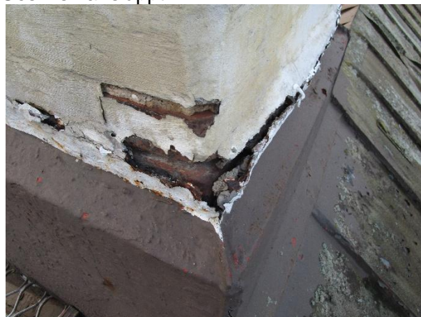
Tätning mellan plåt och skorsten är bristfällig