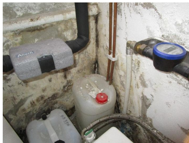
Fuktgenomslag längs ytterväggar