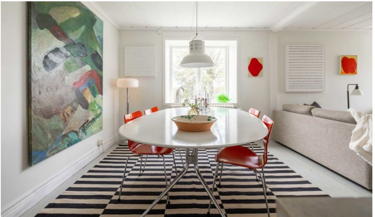
Fint och praktiskt kök i U-form med gott om arbetsytor och förvaring. Planlösningen är öppen mot matsalsdel och vardagsrummet.