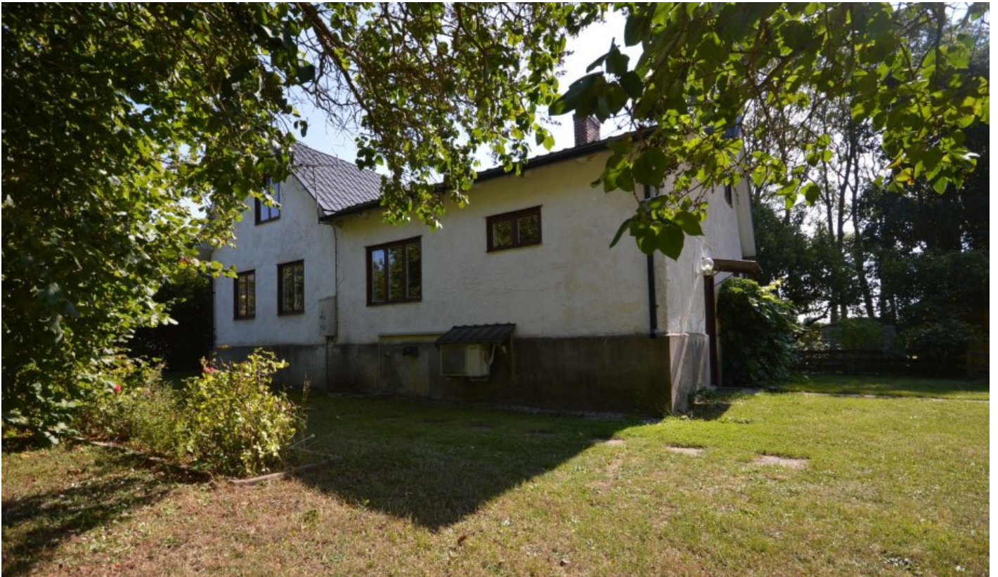
Putsat hus som från början var Mästerbys telefonväxelstation.