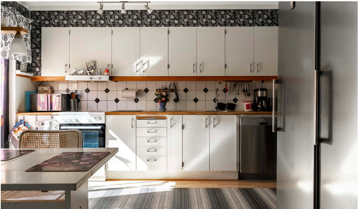
Matrum och kök med utgång till altan.