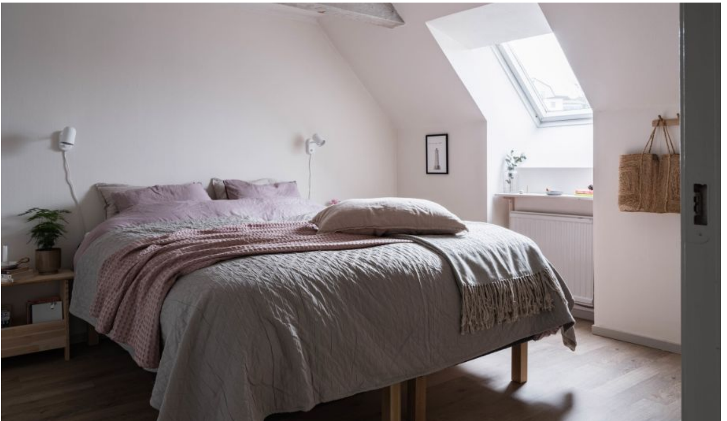
Ett sovrum med takfönster och 5 stora garderober. Det andra sovrummet med fönster mot innergåden och laminatgolv.