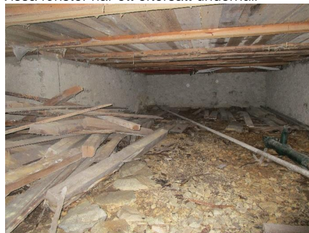
Markfukt och virkesspill på marken i krypgrunden