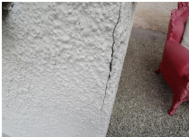
Sprickor i fasadens puts