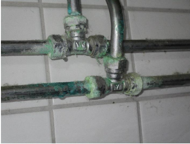
Korrosion och läckage på rörkopplingar under handfat