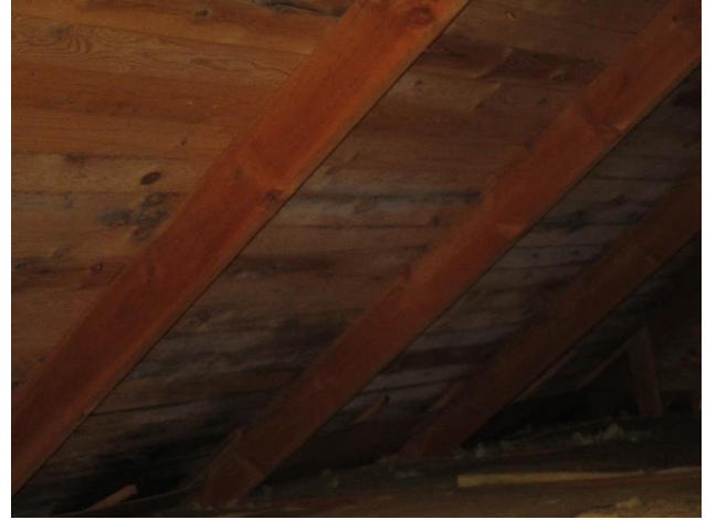
Spår av vitmögel längs yttertaketets insida