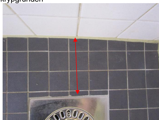
Golvbrunnen ligger för nära vägg