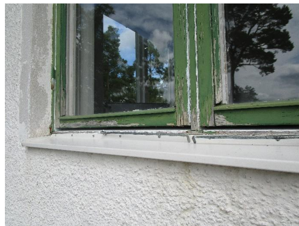
Vissa fönster har ett eftersatt underhåll