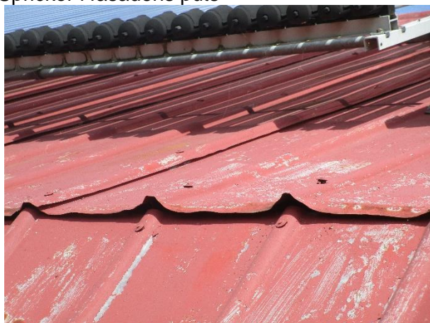
Takplåten börjar glipa i skarvarna